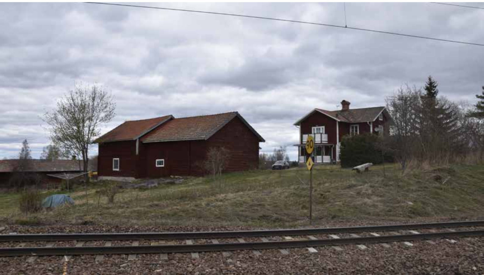
Den delvis kringbyggda Gropgården invid järnvägen mitt i byn. Kullsbjörken 9:14.