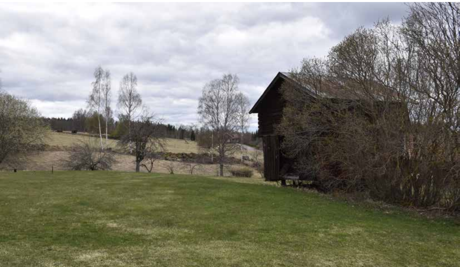
Gavelhärbre med de öppna och hävdade jordbrukslandskapen mitt i byn i bakgrunden. Kullsbjörken 11:11.

varon. Eftersom berättelserna förmedlas av något levande ligger det i sakens natur att det biologiska kulturarvet befinner sig i ständig förändring- det kan vara kortlivat men kan också fortleva i århundraden.