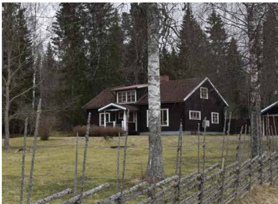
Modernistisk timmervilla uppförd år 1973 med exklusiva spröjsade fönster och assymetrisk allmogeinspirerad farstuvist. Kullsbjörken 1:13.