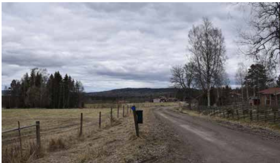
Kullsbjörken är beläget i en nordösts lutning med utblickar mot bland annat Lerdal i Rättviks socken.