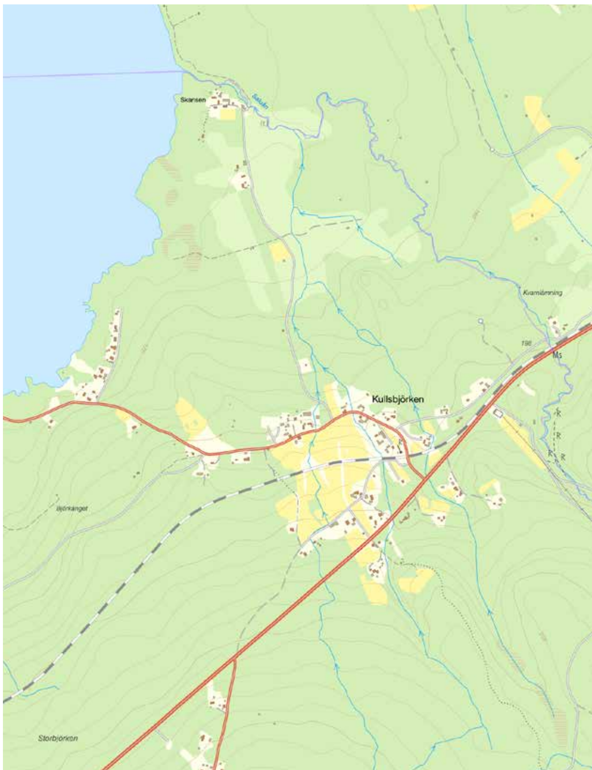
Kullsbjörken är beläget i den norra delen av nuvarande Leksands kommun, nära Saluån som utgör gränsen mot Rättviks kommun och socken. På Salunäset norr om byn fanns förut ett vidsträckt betes- och odlingslandskap med mängder av ängslador varav många återstår på Rättvikssidan om ån.