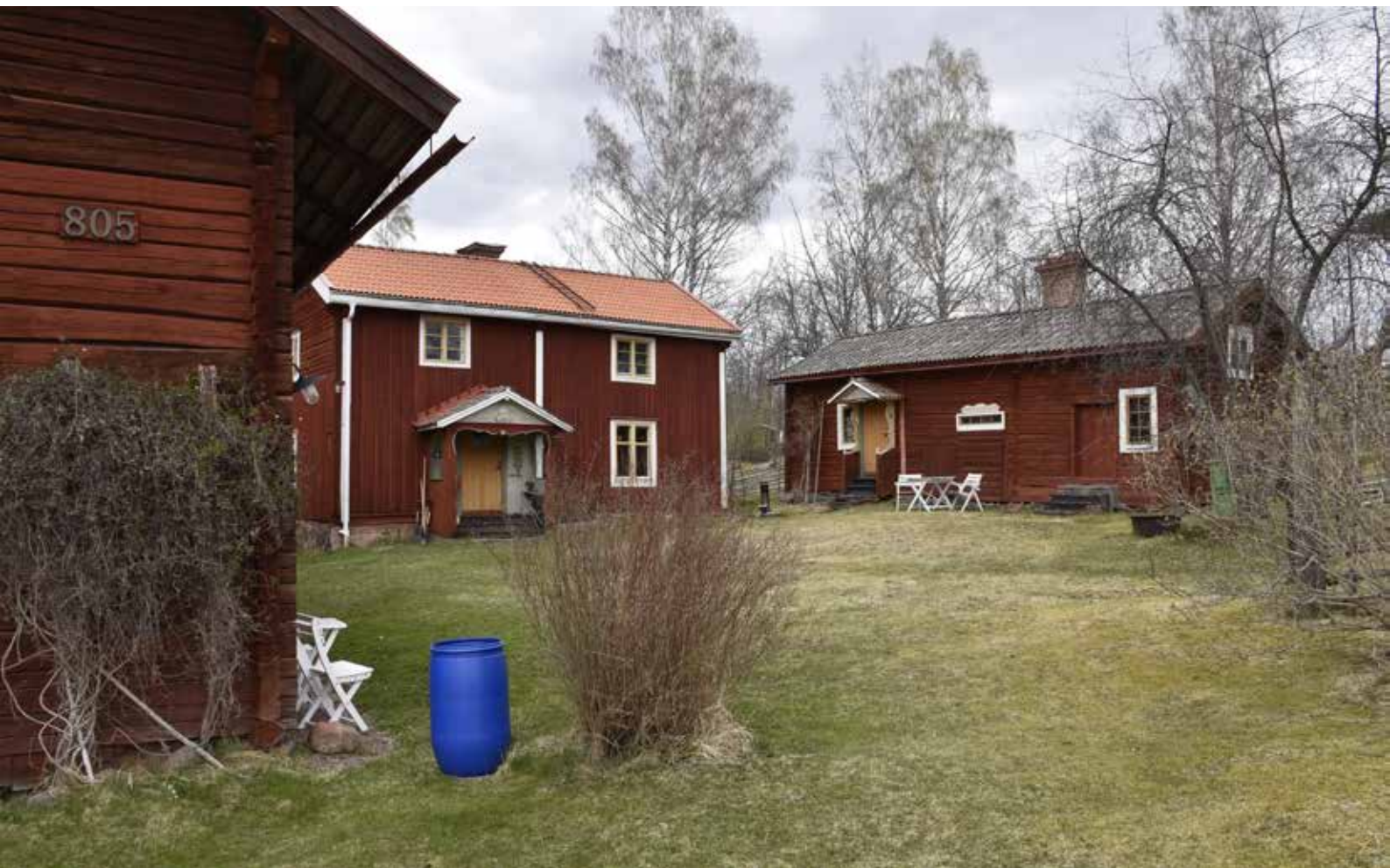
Den delvis kringbyggda och ålderdomliga Tägtgården. Kullsbjörken 17:14.