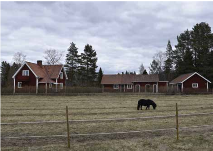
Gård som avstyckades i början av 1900-talet men som bebyggdes först 1929-1935 av fyra ogifta syskon. Kullsbjörken 4:12.