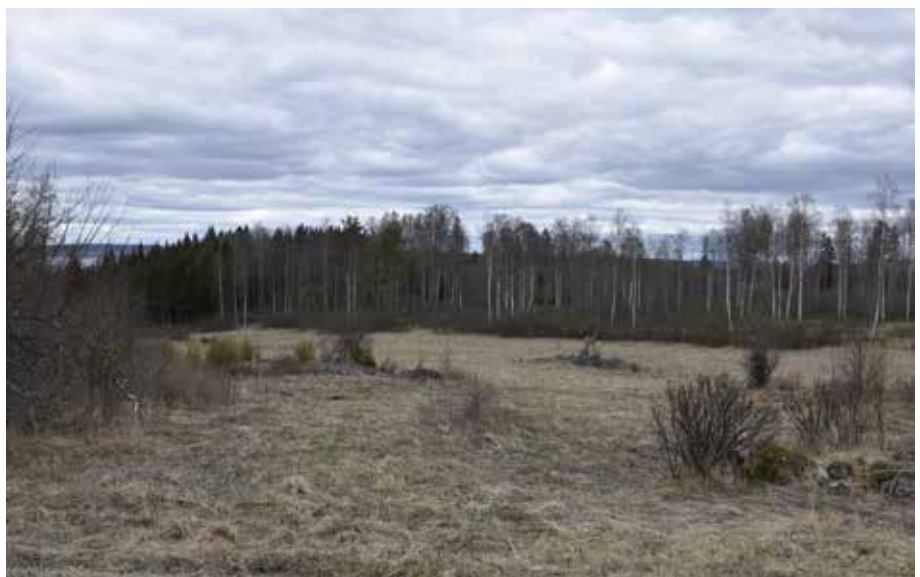
Öppen jordbruksmark med odlingsrösen längs byvägen mot Östanhol i väster.