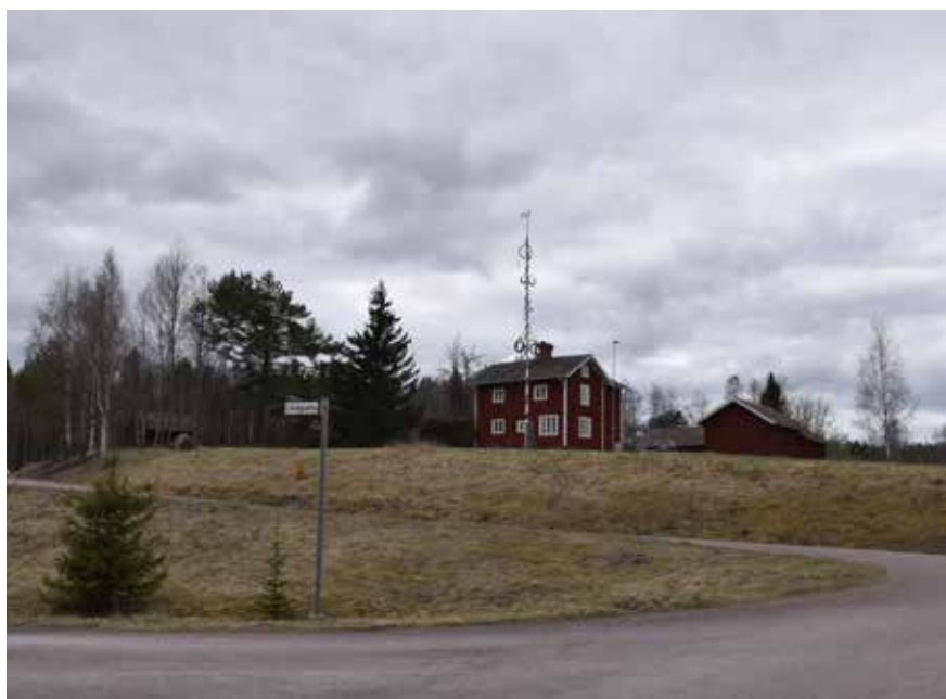
Ovan, Knappgården med sen 1800-talskaraktär med korsplanshus som manbyggnad och vinkelställd ekonomilänga. Kullsbjörken 10:15.