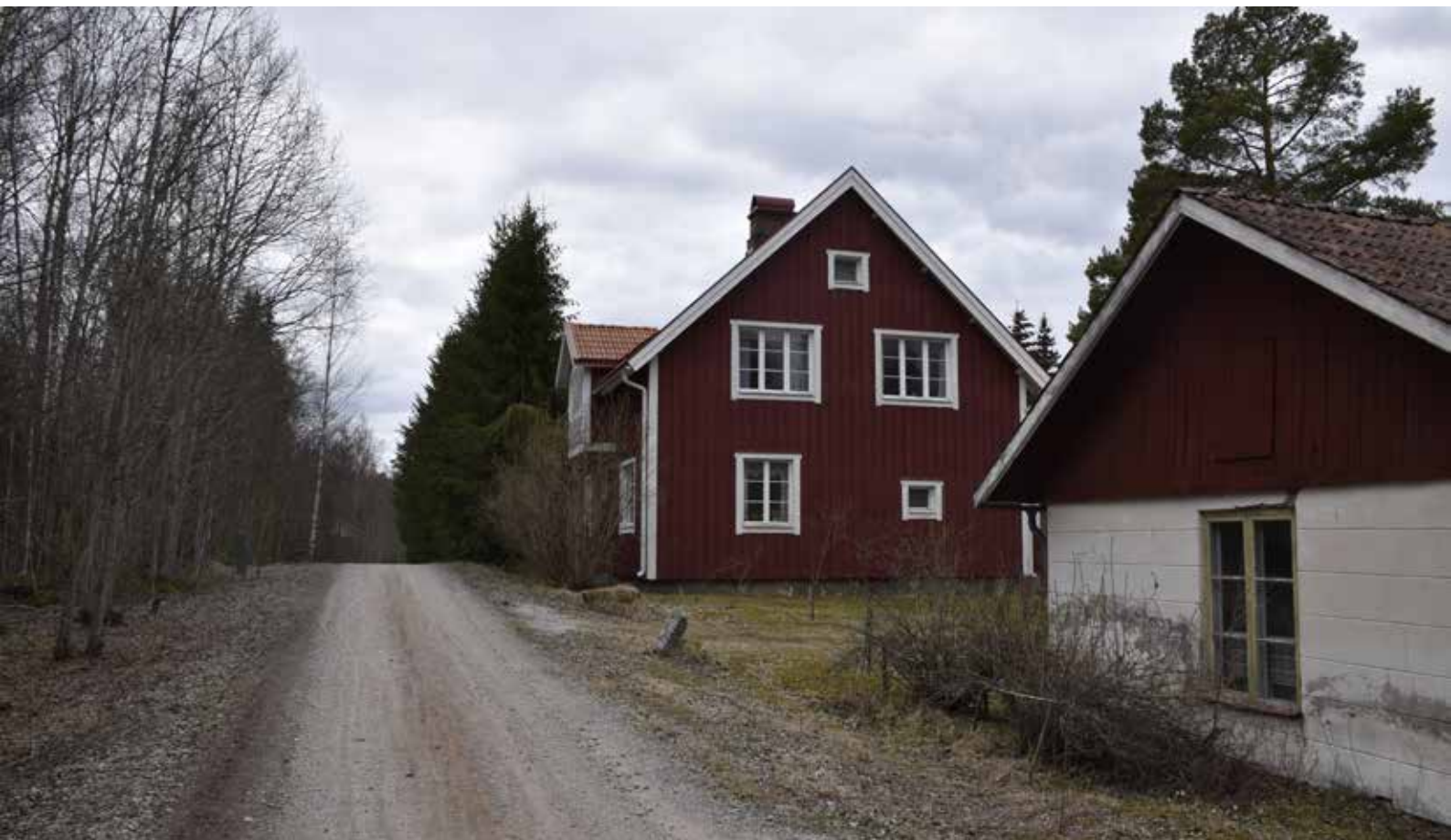
Rapp- eller Hurtiggården som bildades år 1888 och bebyggdes med det nuvarande bostadshuset kring år 1890. Byggnaden ombyggdes sedan med ett brantare tak. På gården fanns enligt uppgift ett tegelbruk under en period. Lalnäs 1:2.