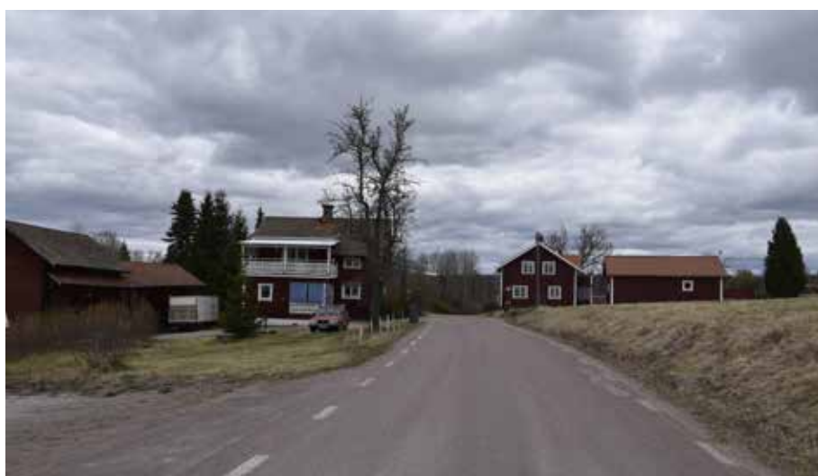
Bebyggelsen är grupperad i klungor och radbystråk längs byvägarna. Till vänster, den anrika Gatugården med anor från 1600-talet. Gården är enligt uppgift byggd år 1666. Kullsbjörken 14:11.