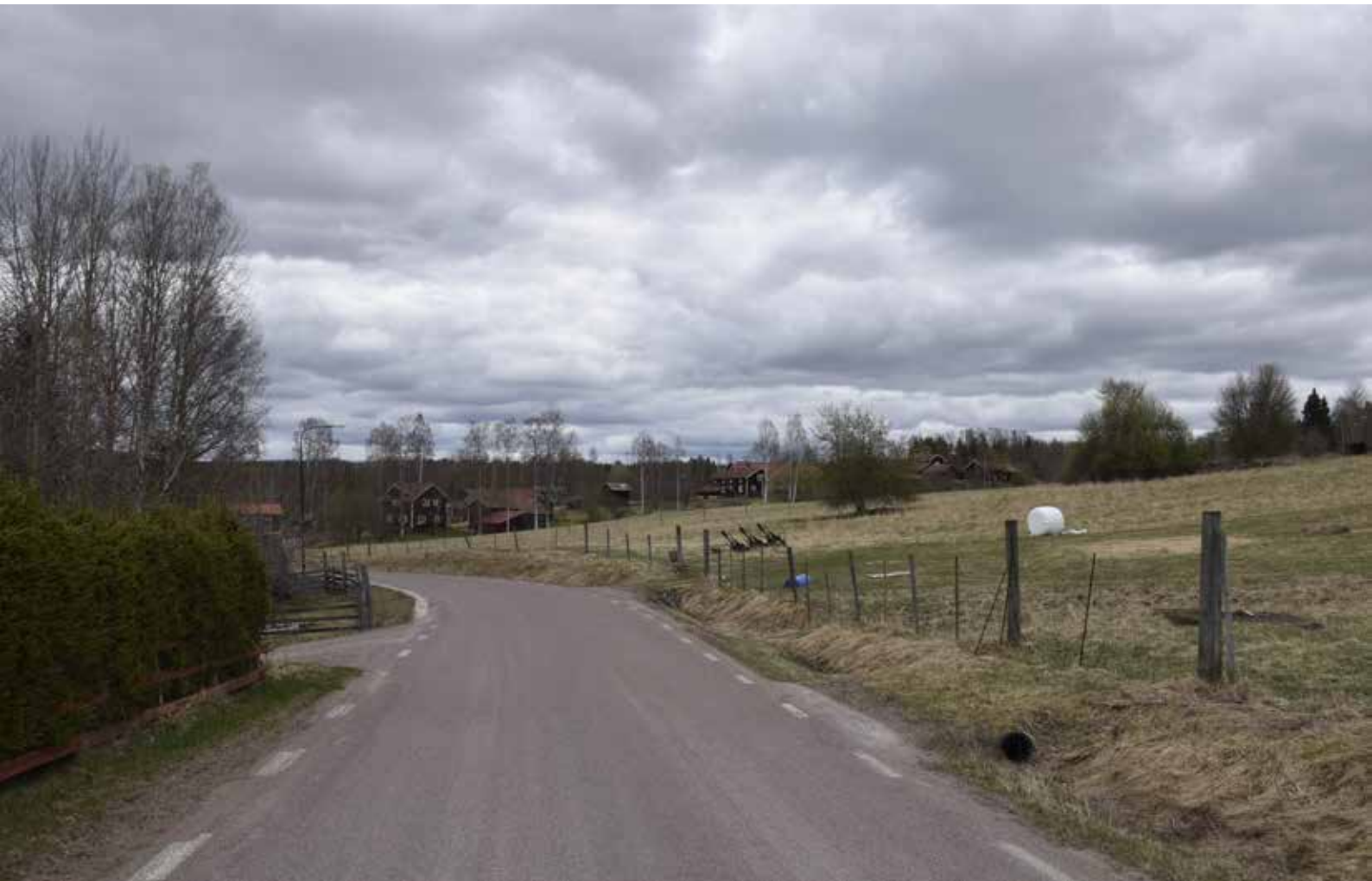
Utblick över det öppna och hävdade jordbrukslandskapen mitt i byn. Bebyggelsen är belägen i hästskoform kring de öppna markerna.