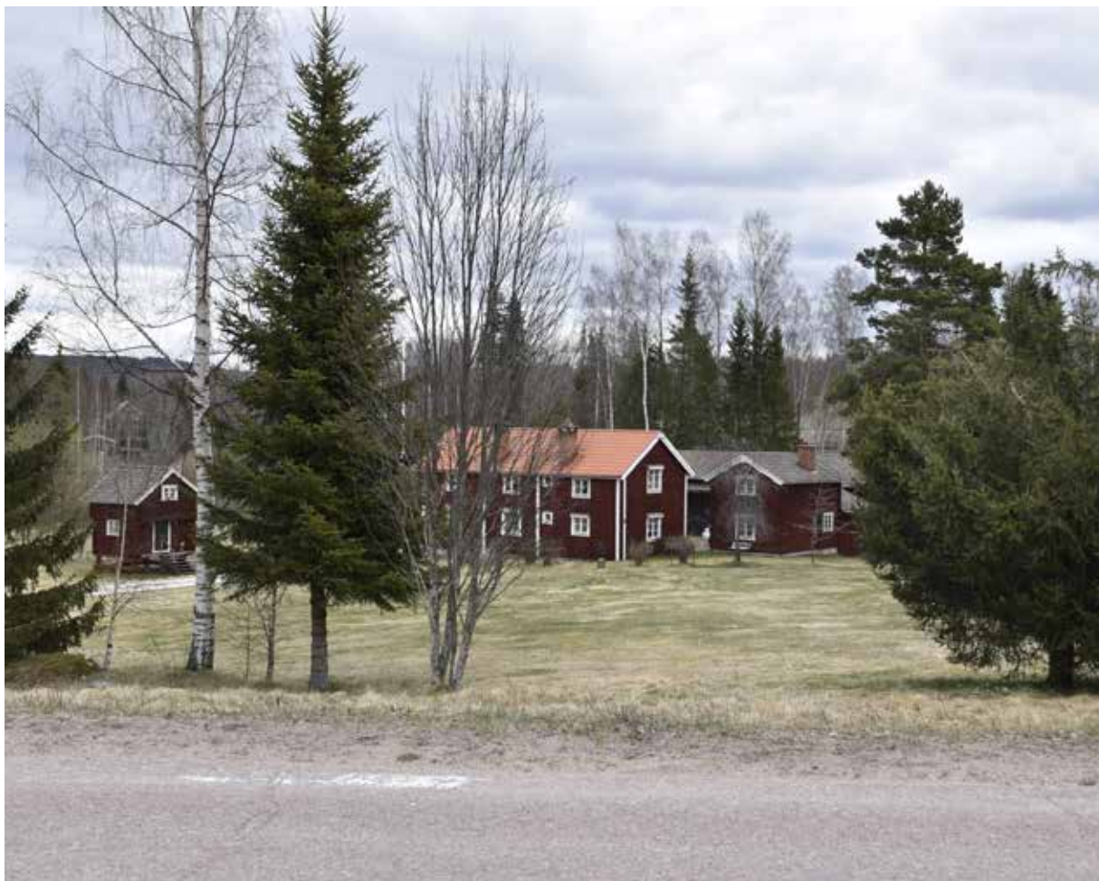
Den kringbyggda Lindgården återuppfördes på ny plats sedan den brann ner på 1800-talet. Gården har varit i samma familj sedan mitten av 1600-talet. Kullsbjörken 11:7.