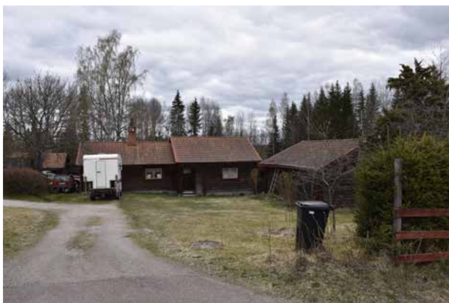
Ekonomibyggnader på den kringbyggda Ollesgården. Kullsbjörken 16:11.