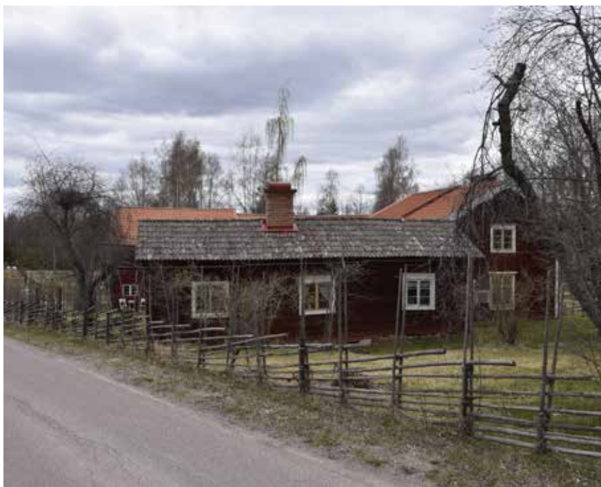
Täktgården är ålderdomlig och välbevarad. De gamla byggnaderna har många intakta ålderdomliga detaljer i form av exempelvis fönster och färstukvistar. Kullsbjörken 17:14.