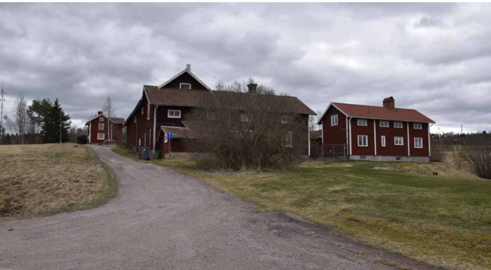
De kringbyggda gårdarna Nyåkersgården och Gropgården mitt i byn, vid majstångsplatsen. Den saluröda färgen präglar merparten av byns bebyggelse. Kullsbjörken 11:11.