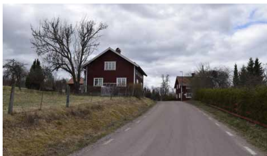
Korsplanshus lika det som syns på till vänster i bilden blev vanliga först under 1800-talets sista decennier. Kullsbjörken 19:5.