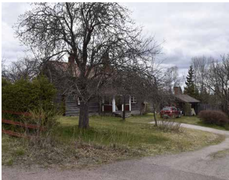
Ollesgården som har gått i arv från far till son sedan åtminstone 1600-talet. Den anrika gården innefattar flera ålderdomliga timmerhus, bland annat en välbevarad parstuga. Kullsbjörken 16:11.