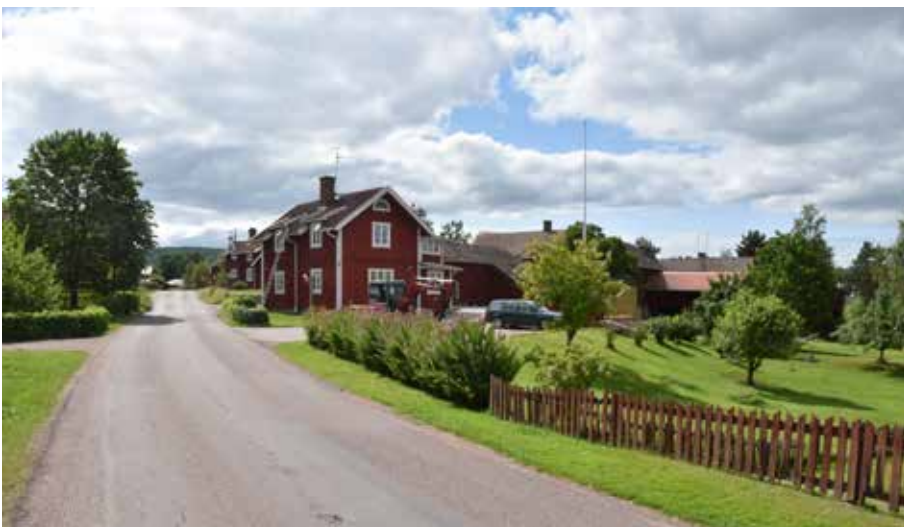
Åsryggen syns tydligt i norr, där marken sluttar ner mot Kattloken i väster. Hagen 14:18.