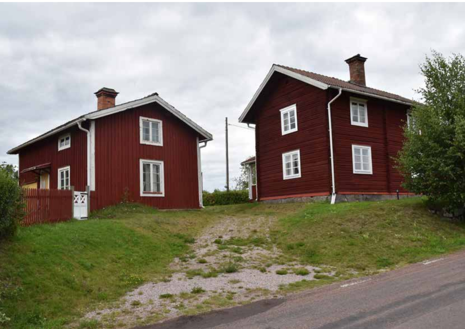
Two well-maintained single-story houses with gabled roofs in the southern part of the parish. Hagen 8:19 and Hagen 8:20.

Det var inte ovanligt att man planterade vårdträd på gårdarna. Det var ofta ädellövträd, som lönn, lind, alm, ek eller ask. Vårdträden skulle i äldre folk-tro beskydda gårdens invånare men kan även ha planterats för att exempelvis markera ett barns födelse.