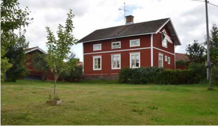
Mycket väl byggnadsvårdat korsplanshus, sannolikt uppfört under tiden kring sekelskiftet år 1900. Hagen 3:7.