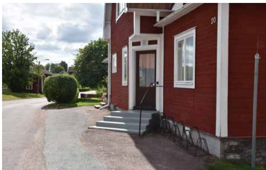
Entréparti på lanthandelsbyggnaden. Hagen 14:5.