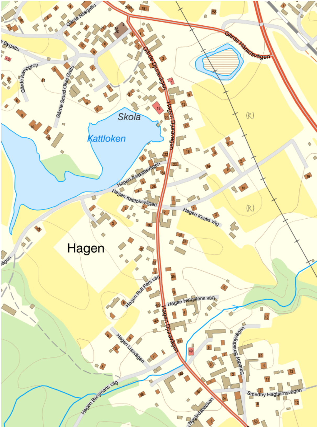
Hagen, en av byarna i Häradsbygden. I norr angränsar byn till Kattloken och Gärde, och i söder till Smedby. I väster berget Asaklitt.