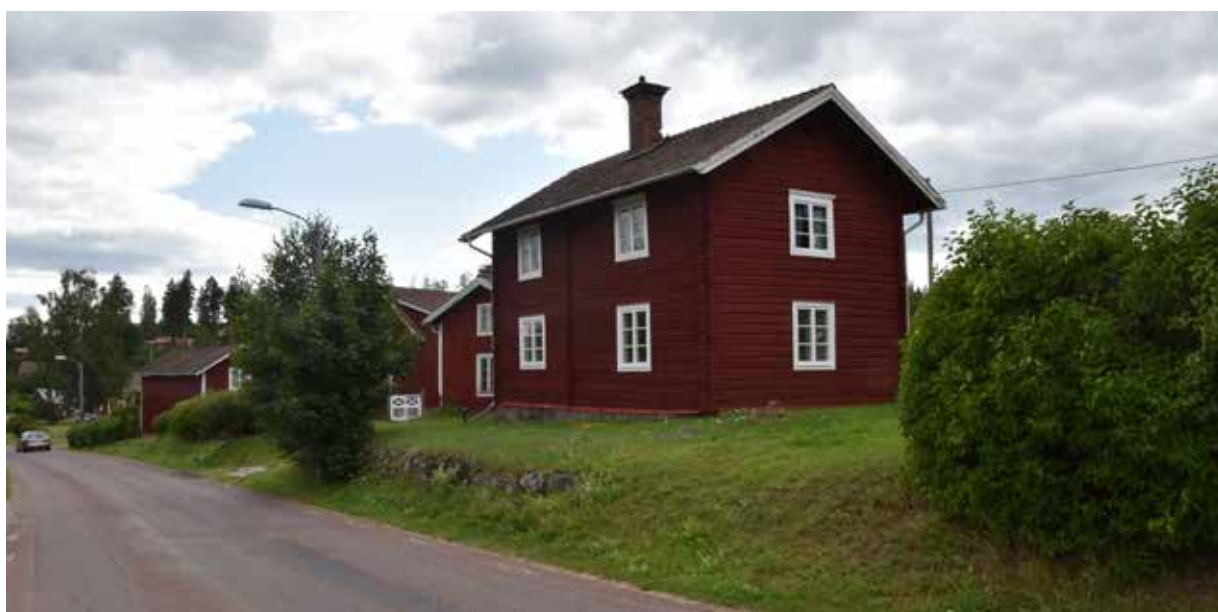
Välbevarad äldre enkelstuga på höjd invid den genomlöpande byvägen. Hagen ligger på en åsrygg i odlingslandskapet. Hagen 8:20.