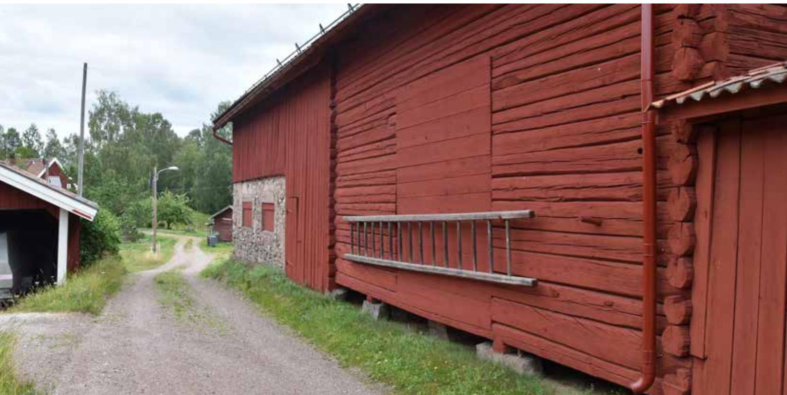
Timrat ladugårdskomplex, sannolikt tillkommet under 1800-talets senare hälft. Hagen 4:12.