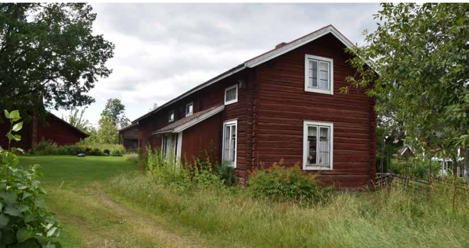
Ålderdomligt bostadshus som är sammanlänkat med ekonomibyggnader till en långa. Byggnaden har ålderdomliga blyspröjsade fönster. Fönsterkarmarna är delvis målade med pariserblå färg, vilket är ett ålderdomligt drag. Gärde 25:2.