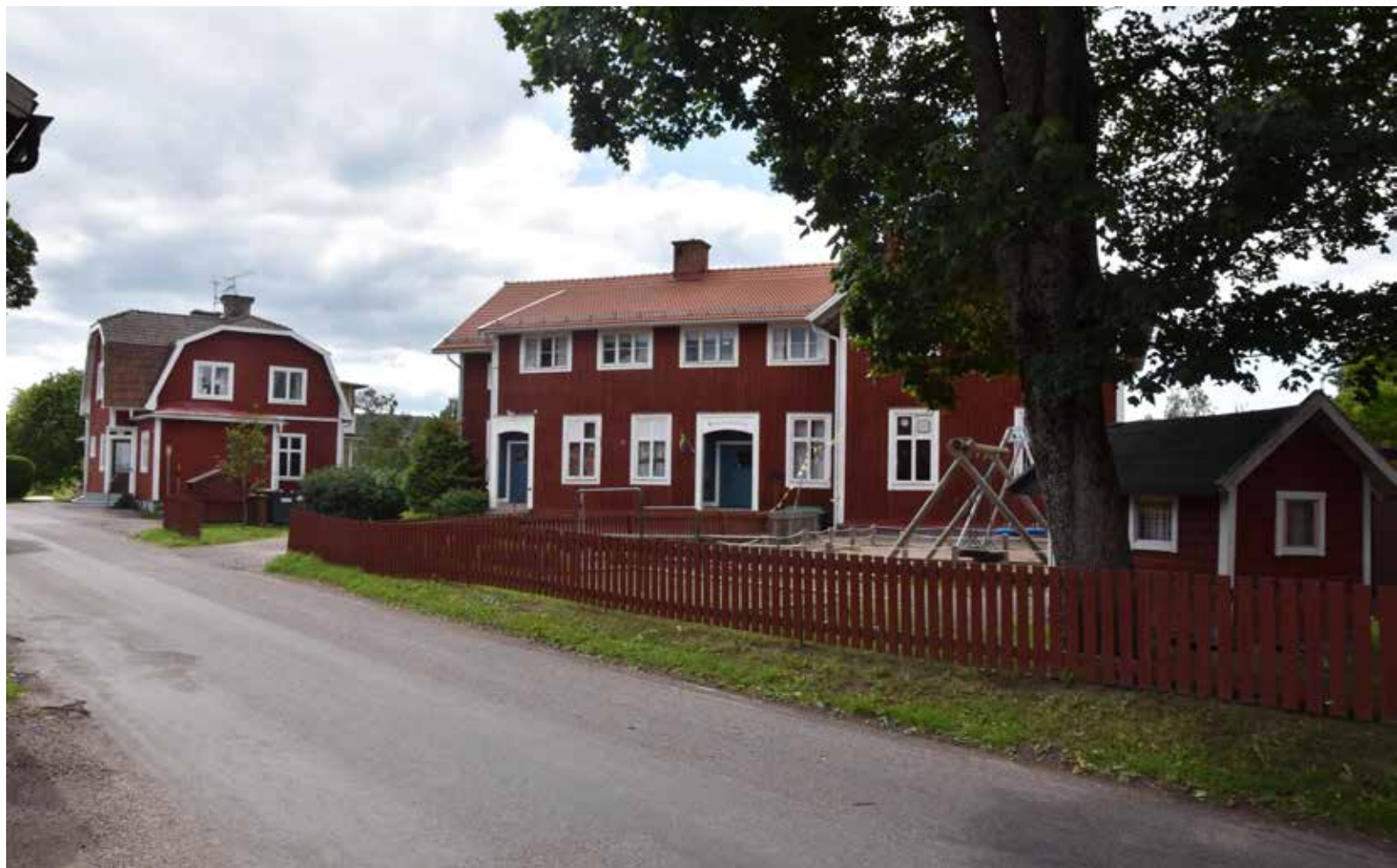
Före detta lanthandel och byskola i den norra delen av byn. Byskolan är delvis välbevarad från när den uppfördes. Lanthandeln har förändrats i många omgångar, men har ett välbevarat entréparti från 1900-talets första hälft. Hagen 14:5 och Gärde 25:4.