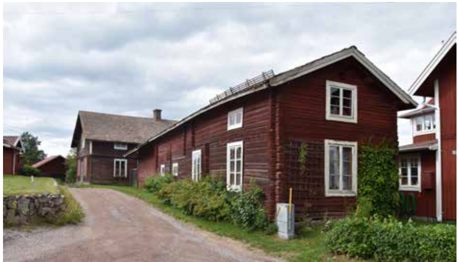
Äldre timmerhus har oftast flackare takvinkel än nyare hus. Hagen 14:18.