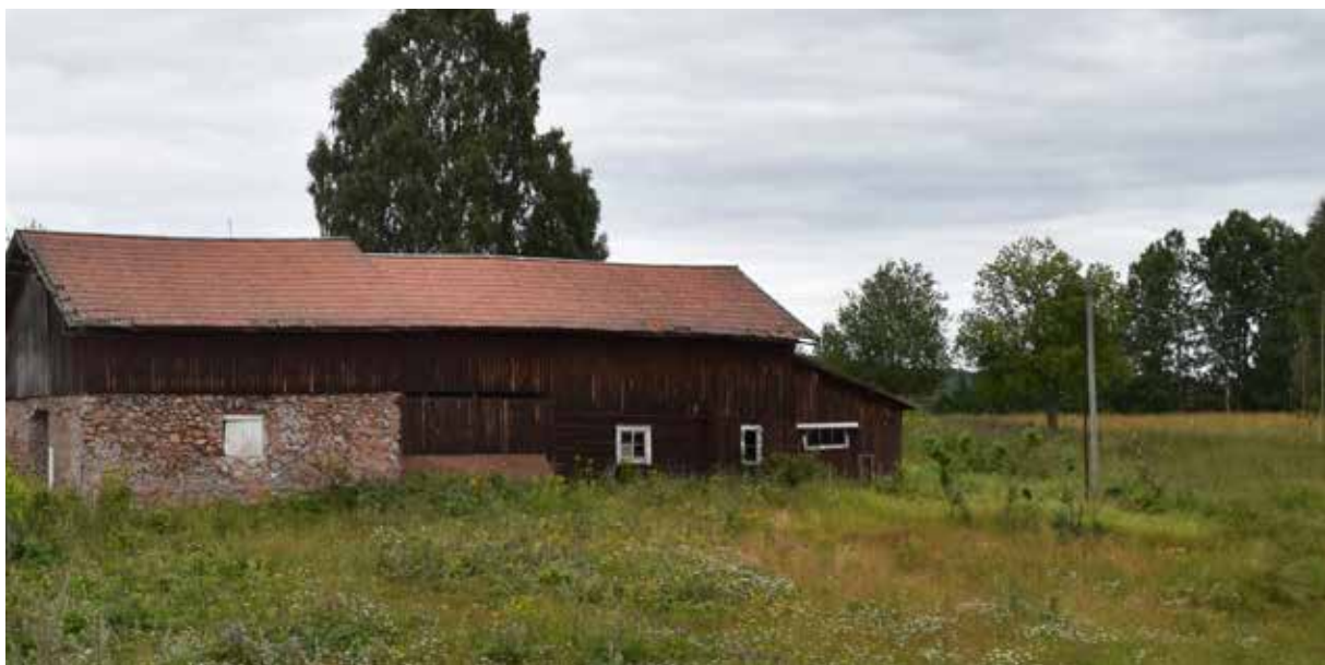
Gård där en del av ladugården är byggd med gjutmursteknik. Leksandsborna var experter på att bygga liknande murar och begav sig därför på långväga arbetsvandringar där de uppförde sådana murar. Hagen 1:68.