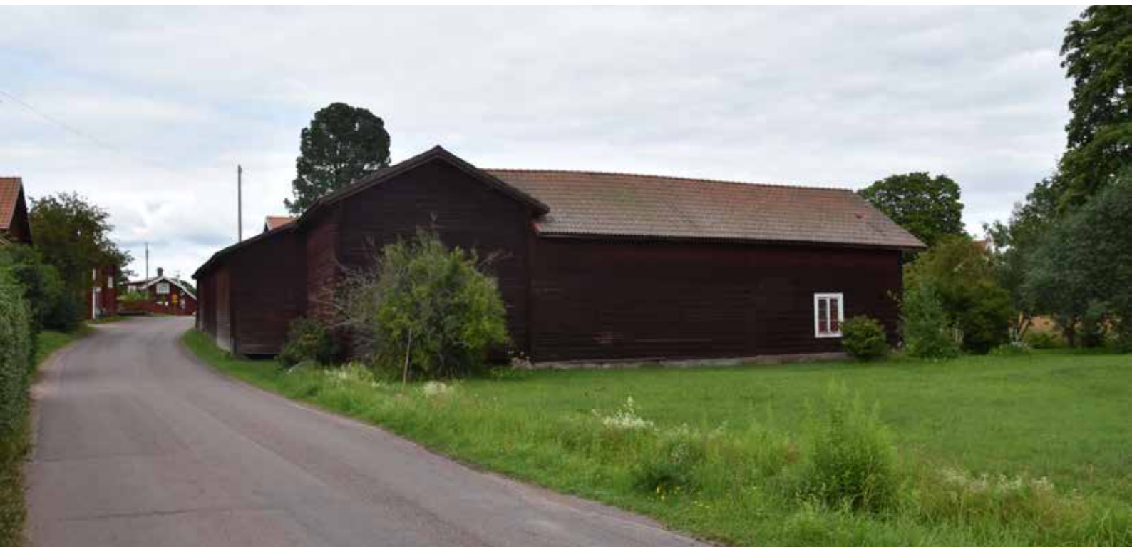
Ålderdomlig kringbyggd gård med vissa äldre timrade ekonomibygnader intill Djuravägen. Hagen 1:39.