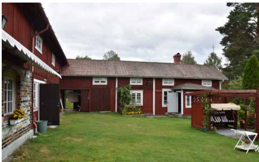
Kringbyggt gårdstun med ekonomibygnader som sannolikt är tillkomna i sitt nuvarande utseende under 1800-talets senare hälft. Hagen 4:5.