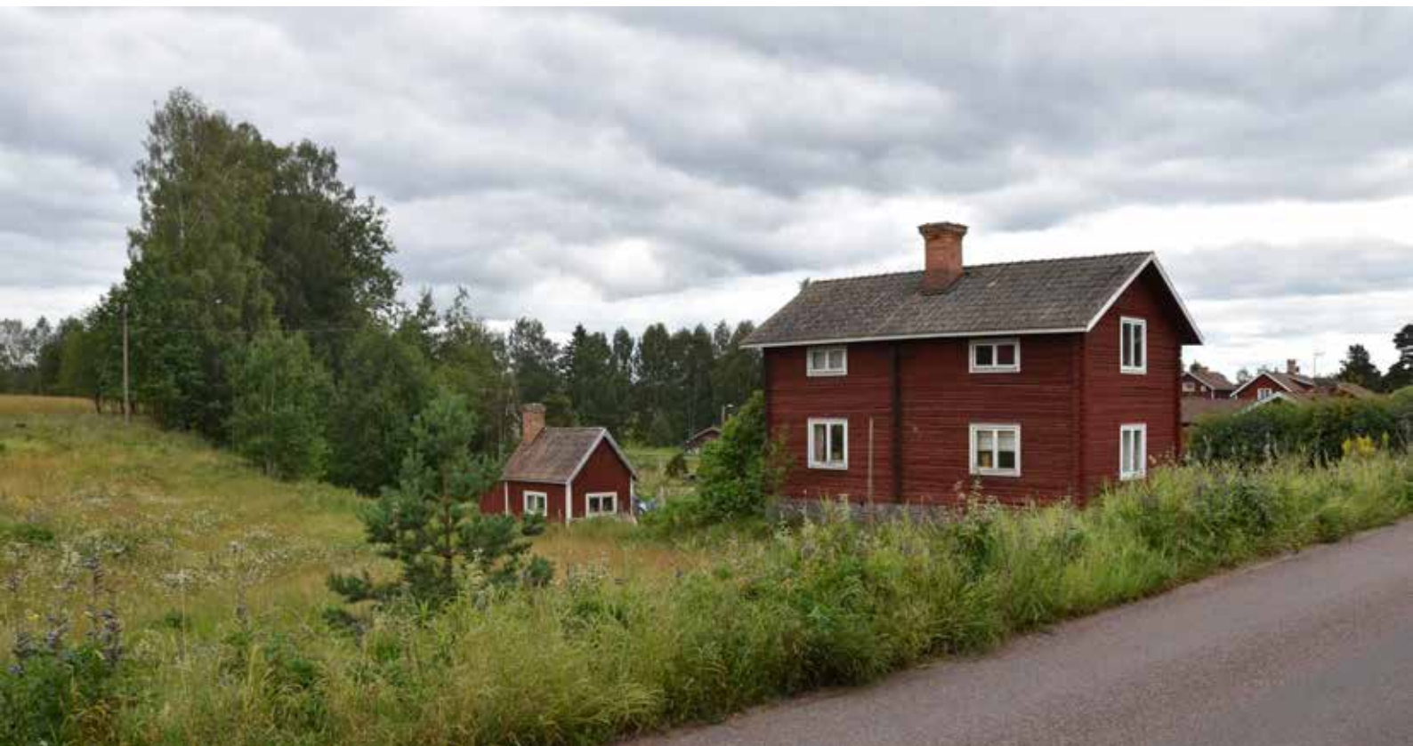
Sänka mot åsgrav väster om Djuravägen. Träden omger Smedbybäcken, bortom finns stora öppna odlingslandskap. Hagen 22:1.